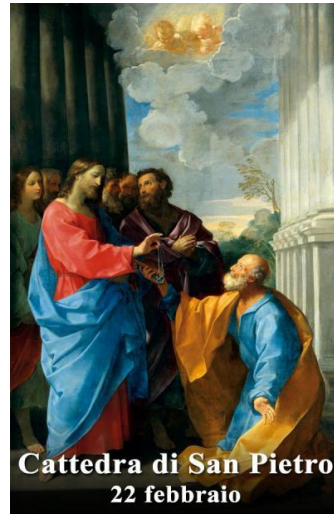
Cattedra di San Pietro 22 febbraio

Festa della Cattedra di san Pietro Apostolo, al quale disse il Signore: «Tu sei Pietro e su questa pietra edificherò la mia Chiesa». Si venera la sede della nascita al cielo di quell'Apostolo, che trae gloria dalla sua vittoria sul colle Vaticano ed è chiamata a presiedere alla comunione universale della carità.