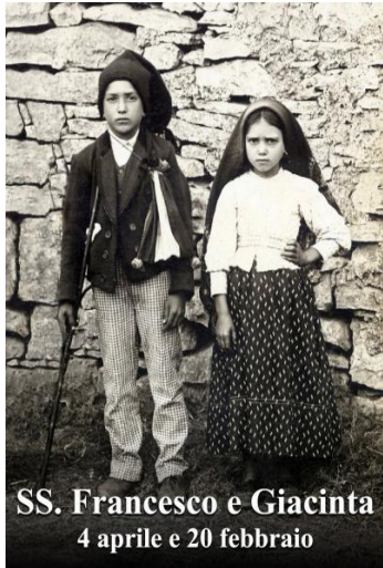
SS. Francesco e Giacinta 4 aprile e 20 febbraio

Fu una dei veggenti delle apparizioni mariane di Fatima in Portogallo. La beata Giacinta Marto, sebbene ancora fanciulla di tenera età, sopportò con pazienza il tormento della malattia da cui era affetta e testimoniò con fervore la sua devozione alla beata Vergine Maria.