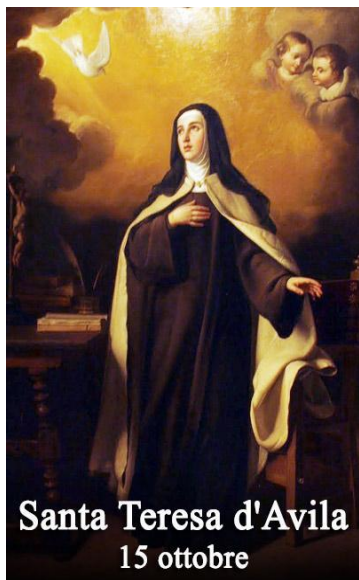
Santa Teresa d'Avila 15 ottobre