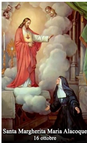
Santa Margherita Maria Alacoque 16 ottobre