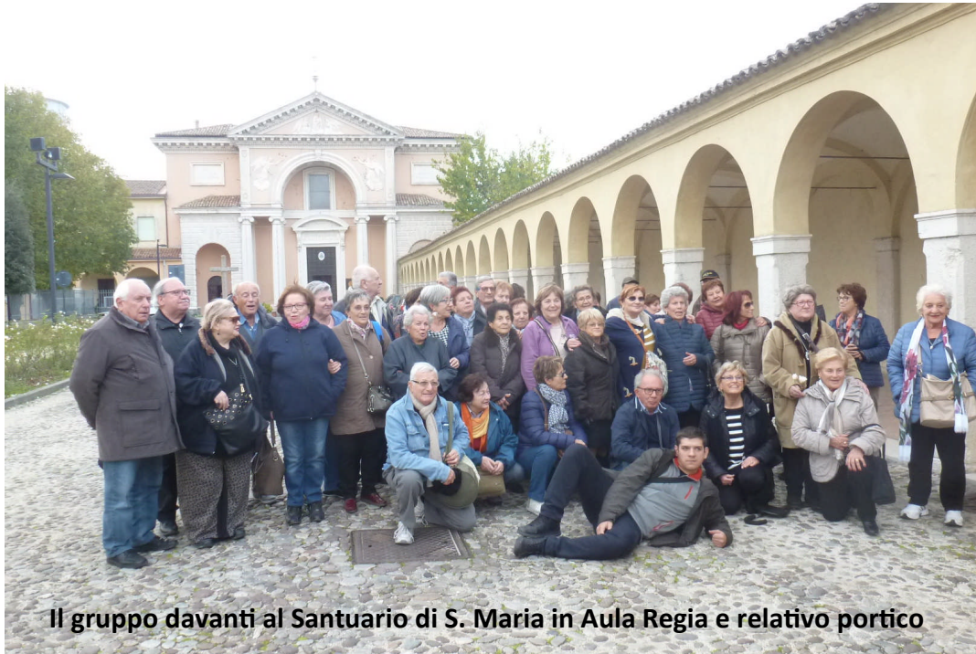
Il gruppo davanti al Santuario di S. Maria in Aula Regia e relativo portico

bonificate, che hanno fornito migliaia di reperti archeologici ( visitabili nel Museo di Spina a Ferrara ) e che oggi sono luoghi di fiorente agricoltura.