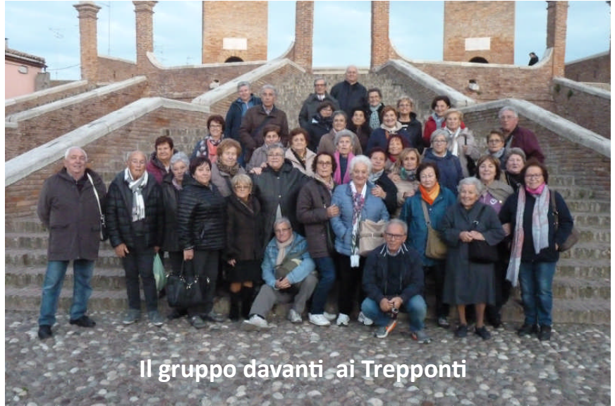
Il gruppo davanti ai Trepponti