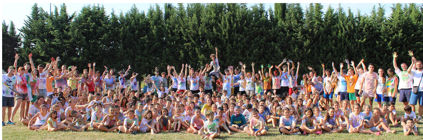
Gli animatori del CEP