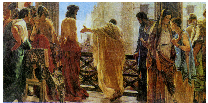
Gesù davanti a Pilato - Antonio Ciseri