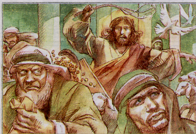
Ai venditori di colombe Gesù disse: «Non fate della casa del Padre mio un mercato».