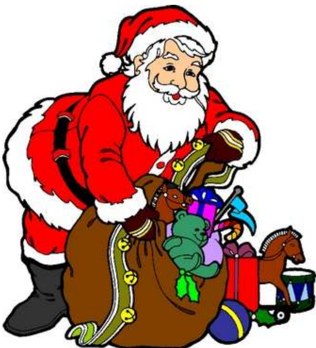
La Tombola dell'Atteso