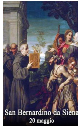
San Bernardino da Siena 20 maggio

San Bernardino da Siena, che per i paesi e le città d'Italia evangelizzò le folle e diffuse la devozione al santissimo nome di Gesù, esercitando instancabilmente il ministero della predicazione con grande frutto per le anime fino alla morte avvenuta all'Aquila in Abruzzo.