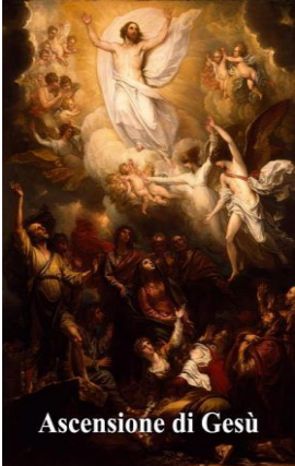
Ascensione di Gesù

Solennità dell'Ascensione del Signore nostro Gesù Cristo, in cui egli, a quaranta giorni dalla risurrezione, fu elevato in cielo davanti ai suoi discepoli, per sedere alla destra del Padre, finché verrà nella gloria a giudicare i vivi e i morti.