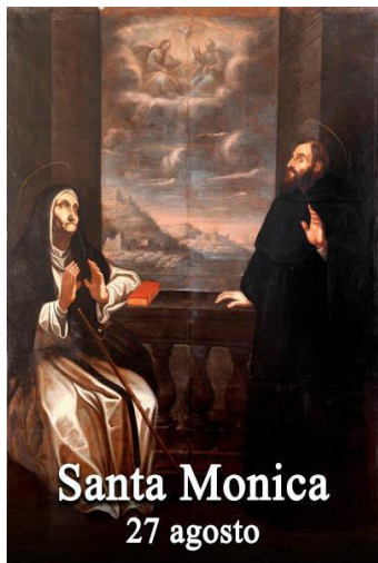
Santa Monica 27 agosto