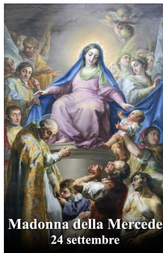
Madonna della Mercede 24 settembre